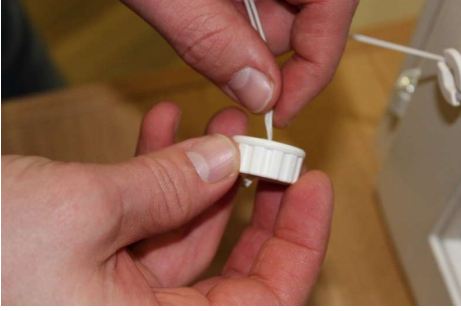
Työnnä narut nupin läpi