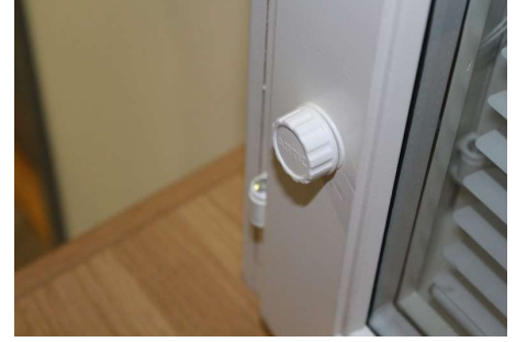
Paina nupin kansi paikalleen.

Varmista että kaihdin on alas laskettuna ja tee vetonaruun solmu noin 30 mm päähän nupista (kutistumisvara). Huom! Varmistas että solmu on riittävän iso, jottei se tule nupista läpi.