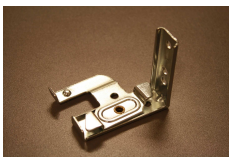
50 mm yleiskannake