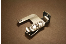
50 mm kattokannake